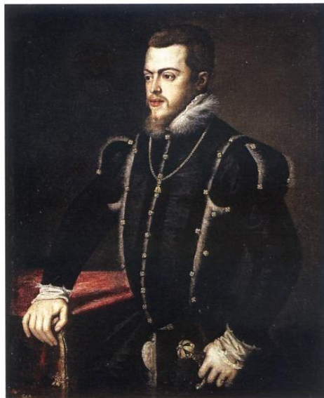
Tiziano Vecellio, dipinto olio su tela raffigurante il re Filippo II di Spagna.

Filippo II d'Asburgo, figlio dell'imperatore del Sacro Romano Impero Carlo V, fu principe di Spagna dal 1554 al 1556 e re dal 1556 al 1598 (fu re di Napoli dal 1554 al 1598), durante il suo regno Napoli entrò in un periodo di lenta ed inarrestabile crisi economica dovuta maggiormente ai prelievi forzosi da parte del governo centrale di Madrid che considerava il sud Italia come una vera e propria miniera dalla quale attingere continuamente risorse per il finanziamento delle sue inutili e costose guerre. Nonostante l'avanzare della crisi ritengo doveroso sottolineare che gli incisori della zecca napoletana furono tra i migliori in assoluto, il realismo dell'espressività del volto del sovrano e la pregevolezza dei conii hanno reso queste monete tra le più belle del periodo. La monetazione napoletana di Filippo II di Spagna è quanto mai vasta, negli oltre quarant'anni di regno vennero coniate numerose tipologie di nominali tra cui una solo in oro e diverse in argento e rame, grazie agli importanti contributi letterali ereditati dai nostri illustri predecessori è possibile giungere ad una classificazione quasi definitiva, eppure qualcosa è sfuggito!