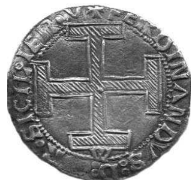
Fig. 6. Ingrandimento.