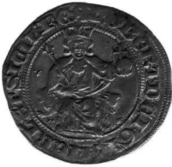
Fig. 2. Ingrandimento.