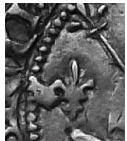
Fig. 1a: Ingrandimento del particolare al dritto di Fig. 1: due gigli in successione, uno incompleto a sinistra e l'altro completo a destra.