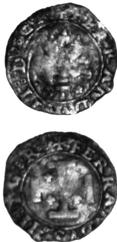
Fig. 8. Ingrandimento.

Il cavallo raffigurato sulle monete e nelle medaglie napoletane vuole anzitutto simboleggiare la capitale del regno meridionale. Infatti è noto che un cavallo sfrenato costituisca l'arma del Sedile napoletano del Nido (detto talvolta Nilo – cfr. Fig. B), invece il cavallo domato al passo coincide con il tema figurativo del Sedile di Capuana (Fig. C). Quest'ultimo in particolare fu scelto a manifesto della nobiltà di Napoli che era incisa su moneta, individuandone quindi l'identità della città. Nella fattispecie però la scelta della direzione del passo del cavallo sul nominale in rame riflette le possibili raffigurazioni delle armi dei sedili. Essa poteva essere qualsiasi (verso destra o verso sinistra indistintamente) anzitutto in quanto anche lo stemma del Sedile di Capuana è noto rappresentato, su incisioni e su sculture, talvolta verso destra ed altre volte verso sinistra, così