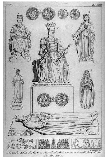
Incisione del 1845 raffigurante la tomba del re Roberto d'Angiò.

Fig. 2. Gigliato (Robertino) a nome di Roberto d'Angiò coniato a Napoli. Argento; Ø: 28 mm ca.; peso: 3.95 grammi; (Collezione Giacomelli).