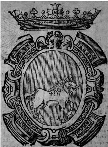
Stemmi degli antichi seggi napoletani del Nido (fig. B) e di Capuana (fig. C).

come, ma con minore ricorrenza, vale per lo scudo del Sedile del Nido. Quindi la differenza di direzione degli equini sui nominali cavalli non è da imputare ad un errore dell'incisore oppure ad una semplice diversificazione operata per distinguere alcune seriazioni, semplicemente costituiva una ulteriore possibilità di raffigurazione del tema topico iconografico, nota a tutti i Napoletani dell'epoca ed in particolar modo alla sua élite nobiliare.