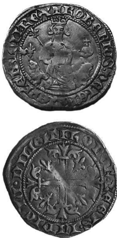
Fig. 1. Ingrandimento.