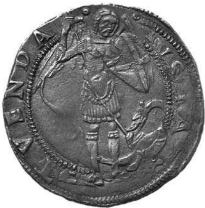
Fig. 7. Ingrandimento.

Nella figura 7 viene invece riportato un singolare errore di punzonatura riguardante il nome del sovrano, il coronato battuto a Napoli in questo periodo presenta al dritto un ritratto che esprime al meglio la raffinata arte rinascimentale partenopea, da notare la finezza della capigliatura rispetto ai tipi precedenti con la croce potenziata al rovescio. Qui il nome del sovrano al dritto risulta essere senza la V ( U ) e quindi “FERRANDS” anziché “FERRANDVS”. Ci piacerebbe segnalarlo come inedito ma, ahimè, si tratta di una errore già citato in diversi testi come ad esempio il Cagiati e il volume XIX del Corpus, la cosa più curiosa è che lo stesso errore è ripetuto in altri esemplari dello stesso tipo ma in diverse versioni riguardanti il resto della leggenda e con diverse sigle di maestri di zecca (cfr. Cagiati 165 e 167 con sigle C , I , oppure MEC 999, con sigla C ). Ciò dimostrerebbe che gli incisori sbagliarono il nome in più di un conio.